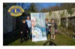
Lions Club de SAINT-MIHIEL 500 €