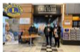
Lions Club BRIEY 1 500€