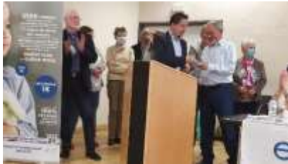
Lions Club de Briey et du Jarnisy