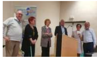
Lions Club de Montigny Europe