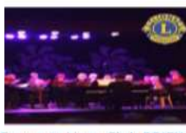
Concerts Lions Club BRIEY 1 600 €