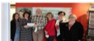
Remise de 1 000 € à l'AREMIG de NANCY pour la décoration d'une chambre de parents, suite à la rénovation de la Maison des Parents