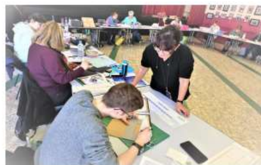
Scrapbooking à Yutz 1 300 €