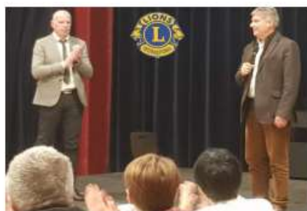
Les Fourchettes du Cœur Lions Club de Gérardmer 3 000 €