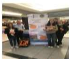
Vente d'Oranges 3 800 €