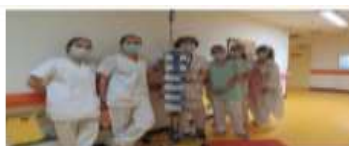
Financement d'un Pousse Seringues Electrique (6 504 €) au service d'Oncohématologie Pédiatrique du CHRU de Nancy Immédiatement installé dans une chambre d'enfant.